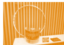
アイデア大賞 模型

立命館守山高等学校 次世代の新構想 膨張性流体防衛シールド 熊本県立第二高等学校 火星の環境における植物の栽培方法の検討 東北大学大学院 衛星-地上間光通信技術実証キューブサット "OPT-CUBE"