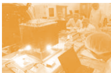
信州大学「ぎんれい」開発の様子