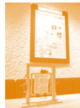
ジュニア大賞 模型