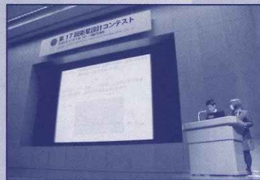
ジュニア部門賞: 微小重力場における煙の拡散 京都府立洛北高等学校