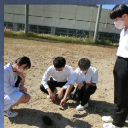
図 3: カプセルの回収をしている様子