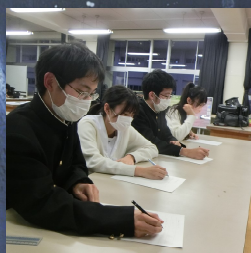
図 1: 手紙を書いている様子