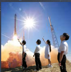
図 2: ロケットの打ち上げを見学している様子